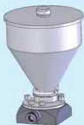
Gruppo tramoggia lt. 8,5 Hopper group 8.5 lt.