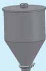
Tramoggia lt. 13 Hopper 13 lt.