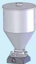
Gruppo tramoggia lt. 13 Hopper group 13 lt.