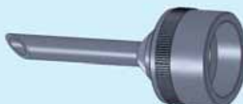
Beccuccio diametro 10 mm 10 mm-diameter nozzle