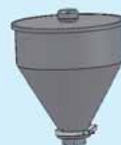
Tramoggia lt. 8,5 Hopper 8.5 lt.