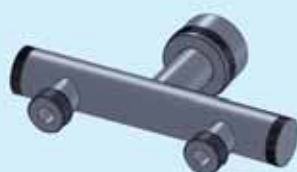
Adattatore tramoggia due uscite Hopper adaptor with two exits