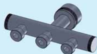
Adattatore tramoggia tre uscite Hopper adaptor with three exits