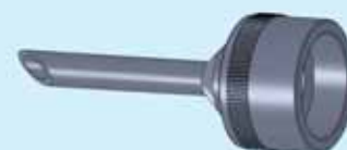
Beccuccio diametro 8 mm 8 mm-diameter nozzle