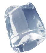
18 gr FULL ICE CUBE