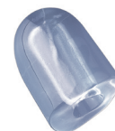
30 gr HOLLOW ICE CUBE